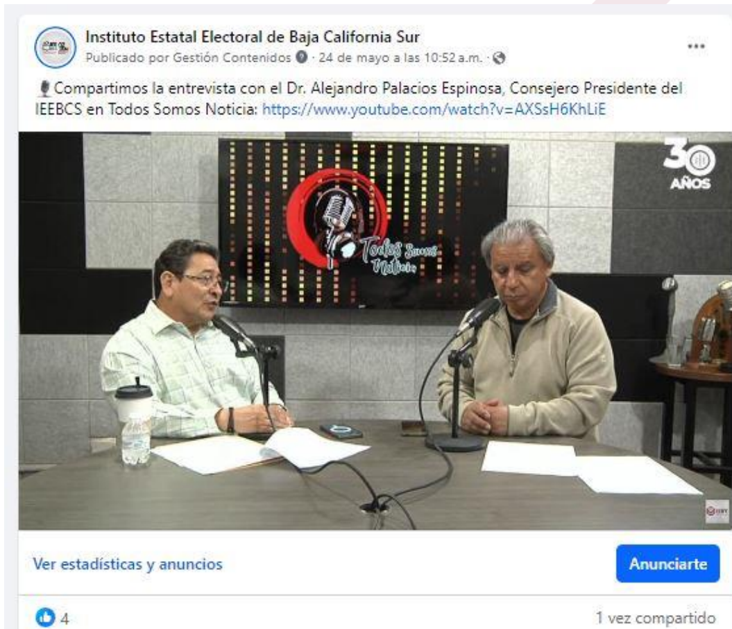
Imagen correspondiente a entrevista con CPS Noticias.