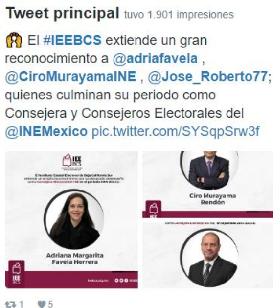
Imagen 3. Correspondiente al Tweet con mayor número de impresiones.