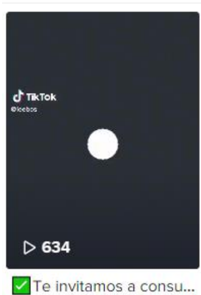
Imagen 5. Correspondiente al mayor número de vistas en Tik Tok.

El mes con el mayor alcance generado en Tik Tok fue marzo con un total de 3 publicaciones con alcance de 679 personas y 17 me gusta.