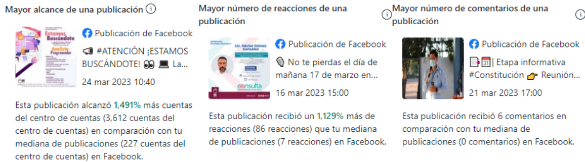
Imagen 2. Correspondiente a los videos con mejor rendimiento en Facebook .