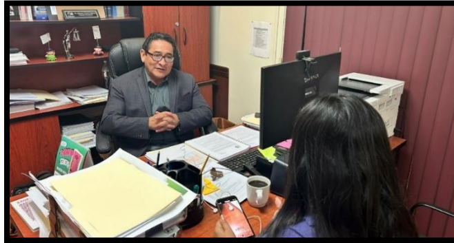
Imagen correspondiente a entrevista con el Zarahí Hamburgo de Canal 8.