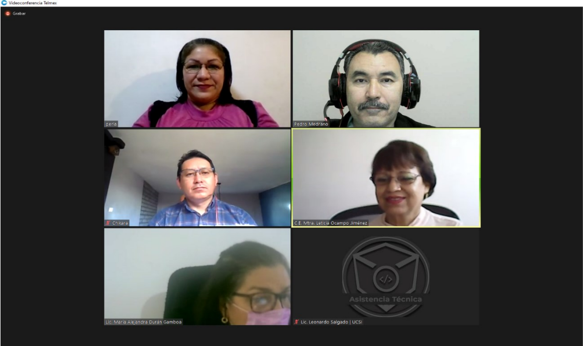
Imagen 4. Sesión extraordinaria de fecha 3 de febrero de 2024.