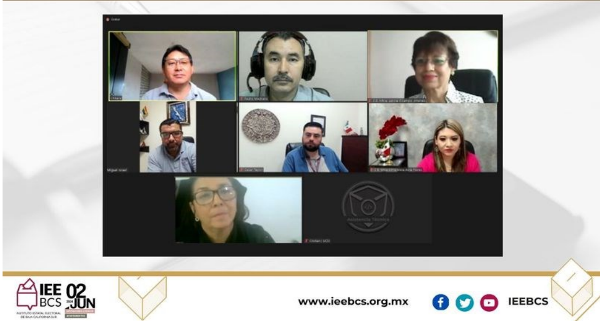
Imagen 2. Sesión ordinaria de fecha 21 de diciembre de 2023