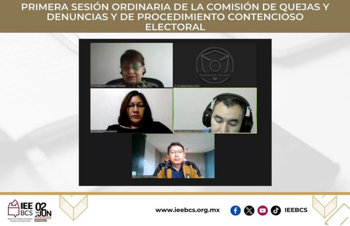
Imagen 3. Primera Sesión ordinaria de fecha 22 de enero de 2024