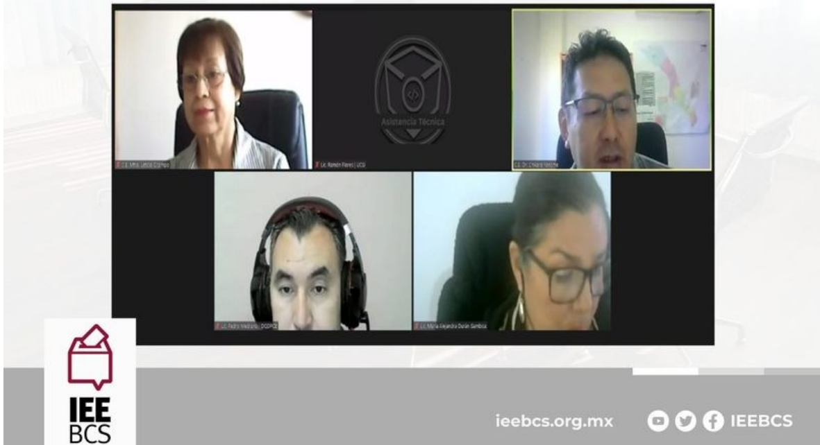
Imagen 1. Sesión extraordinaria de fecha 18 de diciembre de 2023