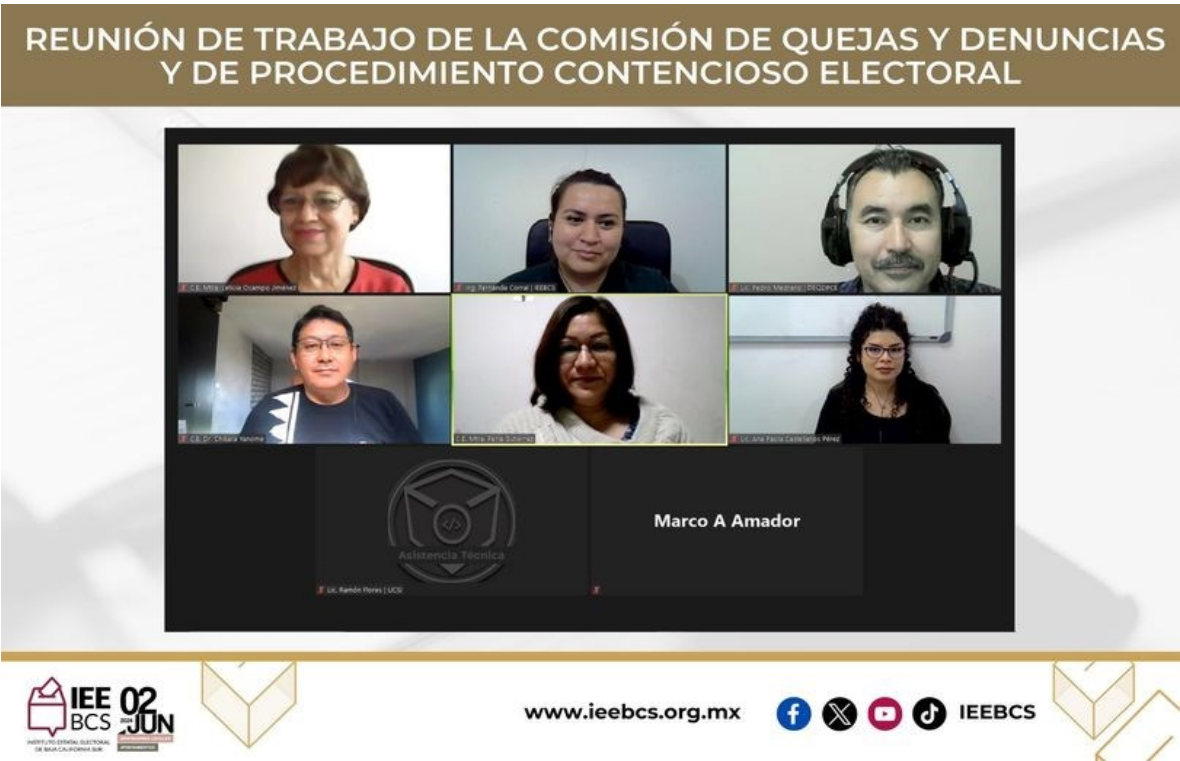
Imagen 5.- Reunión de trabajo de fecha 24 de enero de 2024