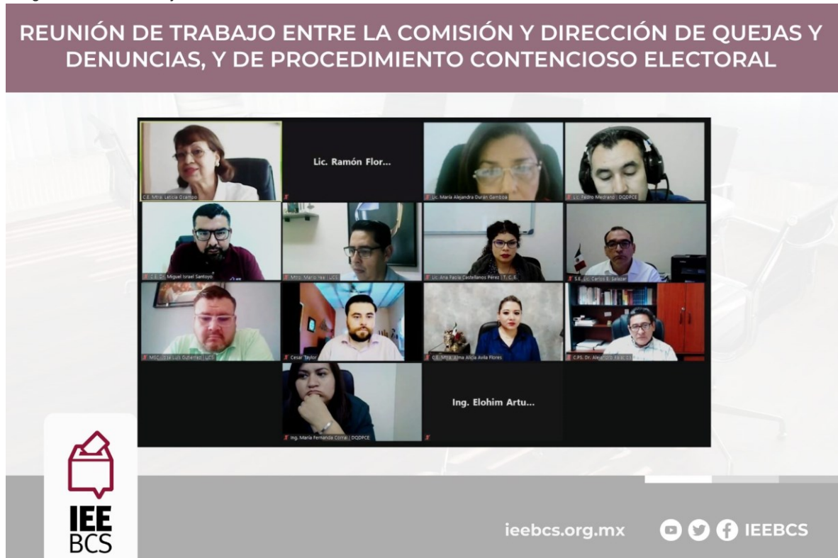
Imagen reunión de trabajo 22-09-2023

En esa reunión se realizaron las pruebas de captura de expedientes integrados, para dar a conocer a quienes participamos en la reunión, del proceso de carga de la información a dicho Sistema.