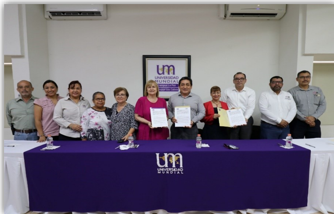
Imagen de la firma de Convenio.