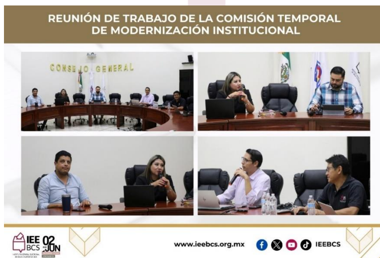
Reunión de Trabajo de la Comisión Temporal de Modernización Institucional, 14 de agosto de 2024.