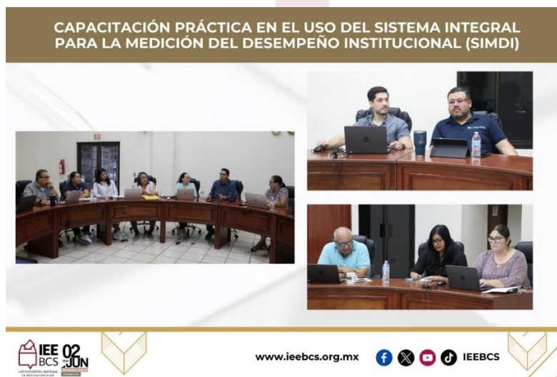
Capacitación práctica en el uso del SIMDI, 17 de julio de 2024.

De lo anterior la Comisión tuvo conocimiento a través de la remisión de informes por parte de la UCSI, así como también presentar dichos trabajos en reuniones de trabajo llevadas a cabo los días 30 de enero, 18 de julio y 14 de agosto del presente ejercicio.