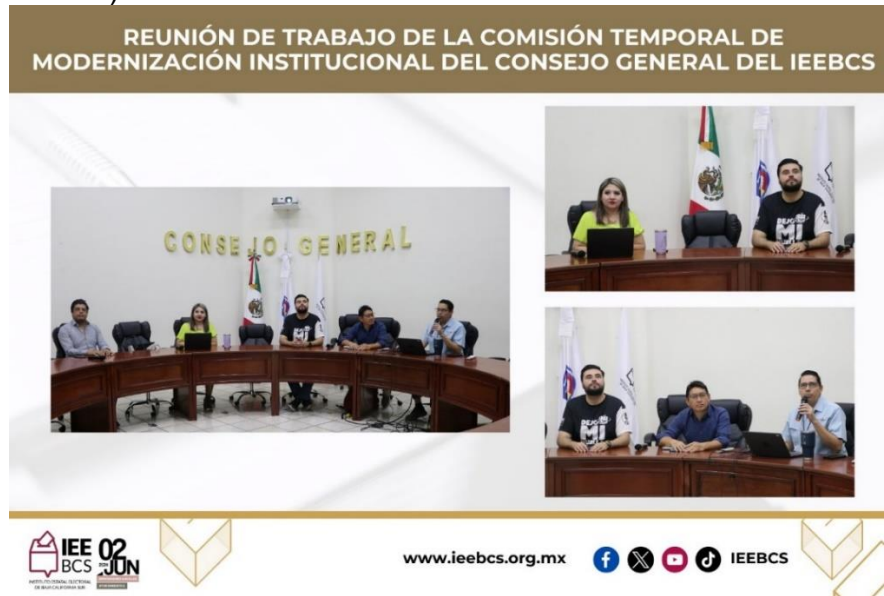
Reunión de Trabajo de la Comisión Temporal de Modernización Institucional, 18 de julio de 2024.