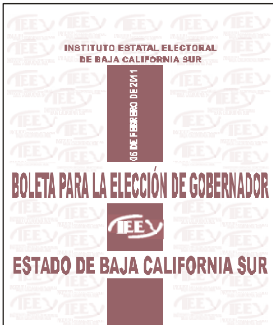
REVERSO DE LA BOLETA PARA LA ELECCIÓN DE GOBERNADOR

Para el caso de las boletas de Gobernador y Diputados de Mayoría Relativa presentan el mismo diseño en el reverso con la variante de la elección a la que pertenezca.