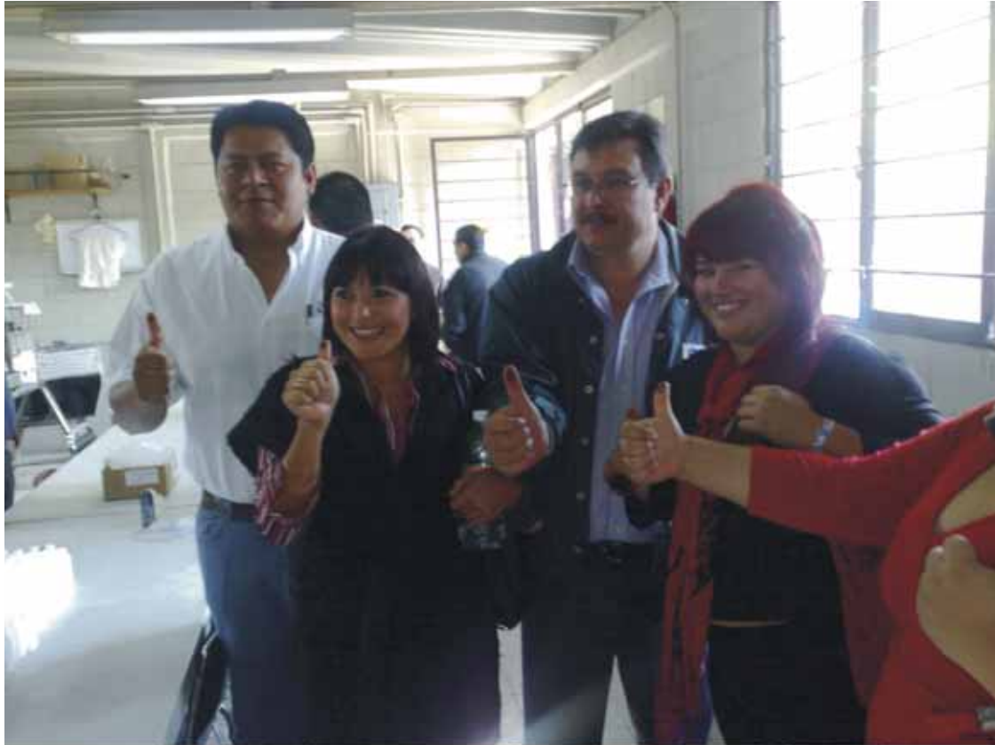
Consejero y Representantes de Partidos Políticos en pruebas de la tinta indeleble.