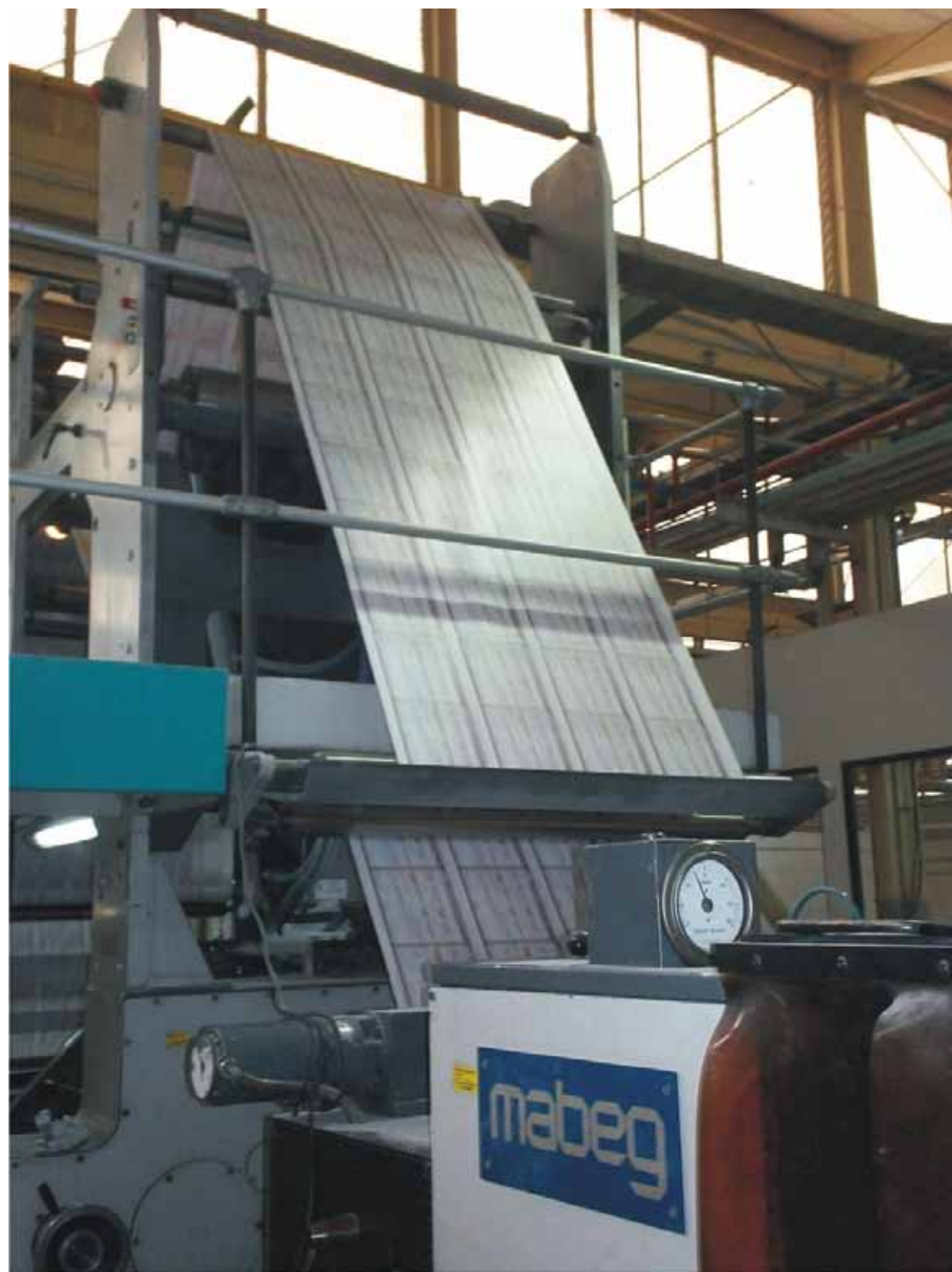
Arranque de la impresión de boletas en Talleres Gráficos de México.